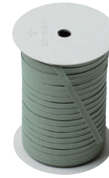
33. ウィロー CODE | 333333