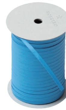
46. ニゼル CODE | 333346