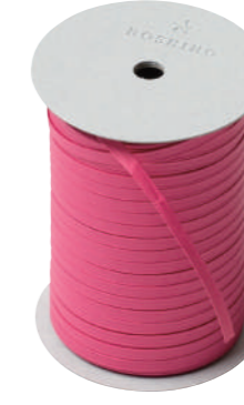
42. フランボワーズ CODE | 333342