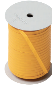
45. ジュネ CODE | 333345