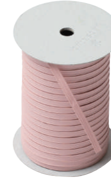
32. オルセーユ CODE | 333332