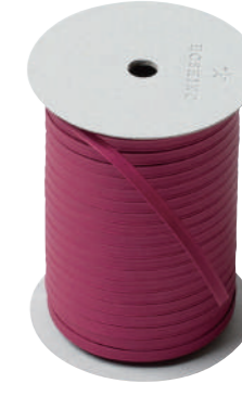
7. テュリップ CODE | 333307