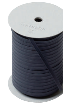
27. ブルーニューイ CODE | 333327