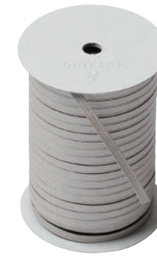
30. アルジャン CODE | 333330