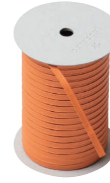
44. オランジュルーシー CODE | 333344