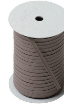
16. ベージュグリーゼ CODE | 333316