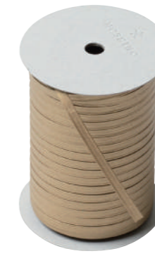
29. オール CODE | 333329