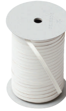
1. ブランカーセ CODE | 333301